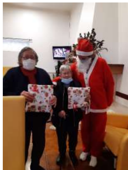
Visita do Pai Natal