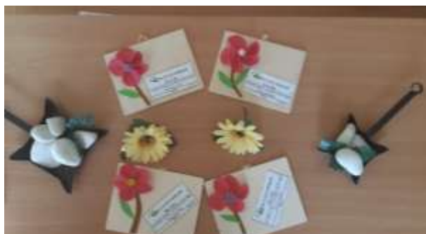
Dia da Mãe