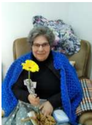
Dia da Mulher