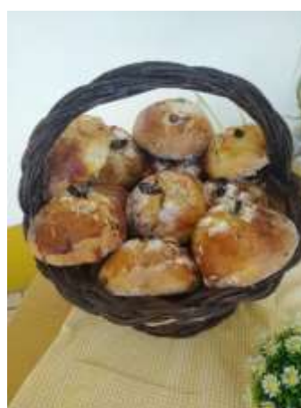
Dia de Reis