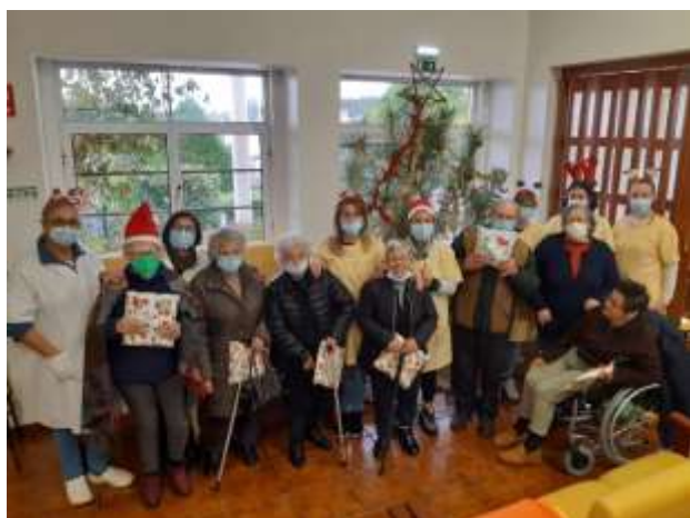
Entrega de Presentes de Natal