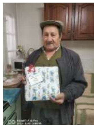
Entrega de presentes- Serviço de Apoio Domiciliário