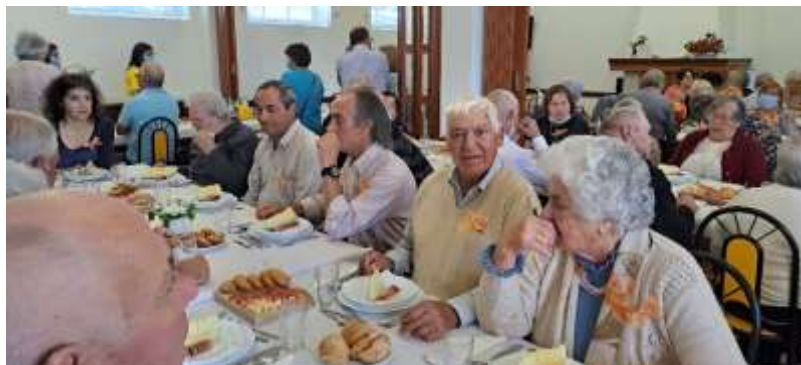
Dia do Idoso