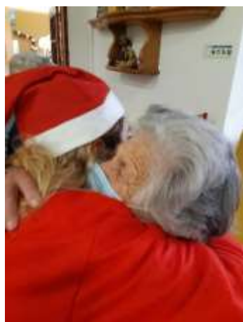
Visita do Pai Natal