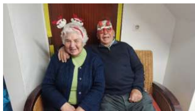
Entrega de presentes- Serviço de Apoio Domiciliário