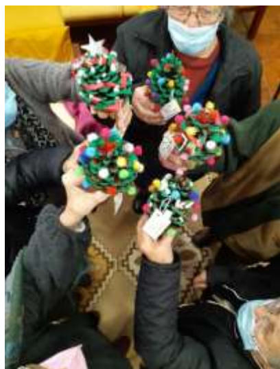
Atividades de Natal