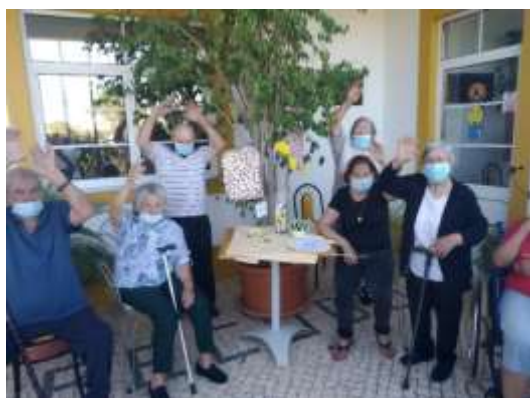
Dia dos Avós